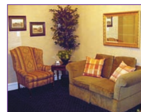
Le servimos tomando en cuenta sus costumbres y deseos.